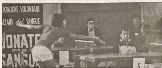
Nella foto un momento della seconda edizione disputata nel 1977 nella Palestra di San Lino

Il Tennistavolo Volterra, con l'approvazione del Comitato Regionale della Federazione Italiana Tennistavolo organizza domenica 3 Aprile presso il Palazzetto dello Sport di S. Felice la 32ª edizione del Trofeo A.V.I.S., torneo regionale riservato agli atleti della Toscana.