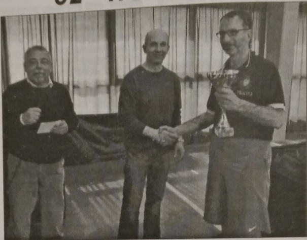
Nella foto il Vice sindaco premia il vincitore della gara Singolare Maschile 4ª N.C.