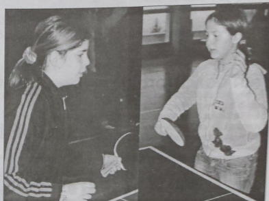
La finale femminile