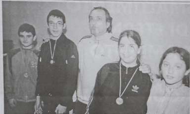
La premiazione dei finalisti