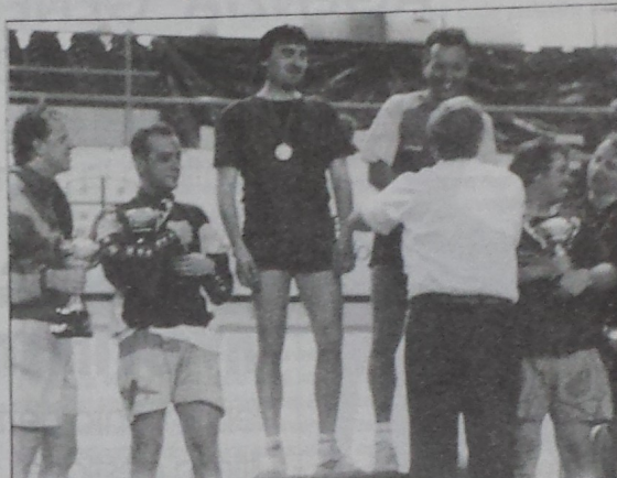
Nella foto il nostro atleta, sul podio, al momento della premiazione

La Liguria porta buono alla nostra società. Il primo titolo italiano fu conquistato ai Giochi della Gioventù che in quell'occasione venivano svolti a Genova. I Campionati Italiani erano stati programmati a Cuneo ma a causa dell'alluvione che nei mesi scorsi aveva colpito il Piemonte rendendo inagibili i palazzetti sono state dirottate in quel di Alassio.