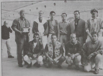
La squadra vincitrice del Torneo di Calcio a 5. Resto del Mondo

Martedì 27 settembre scorso si è svolta, all'interno della Casa Penale di Volterra, la ormai tradizionale cerimonia di premiazione dei Tornei Sportivi tra detenuti del Carcere di Volterra ed atleti appartenenti alle Società Sportive della Val di Cecina, organizzati dal comitato UIISP Alta Val di Cecina con la collaborazione della Direzione della Casa Penale ed il contributo del Comune di Volterra. Questa manifestazione giunge a conclusione di quattro mesi di gare, tornei e incontri di varie discipline sportive che hanno visto anche quest'anno, dal mese di giugno al mese di settembre, una partecipazione molto cospicua tra atleti esterni ed interni. Si è iniziato nel mese di giugno con il Torneo di Tennis per poi proseguire con i Tornei di Tennistavolo, Scacchi, Tressette, Bocce, Billardo e Calcio a 5, quest'ultimo conclusosi ai primi di settembre. La cerimonia di premiazione ha in qualche modo ripercorso questi quattro mesi di attività, mettendo l'accento più volte sul carattere sociale dell'iniziativa che permette ai detenuti di passare delle giornate diverse dalla monotonia che viene imposta dalla vita carceraria e soprattutto dà loro l'opportunità di fare sport e di avere un contatto con il mondo sportivo esterno.