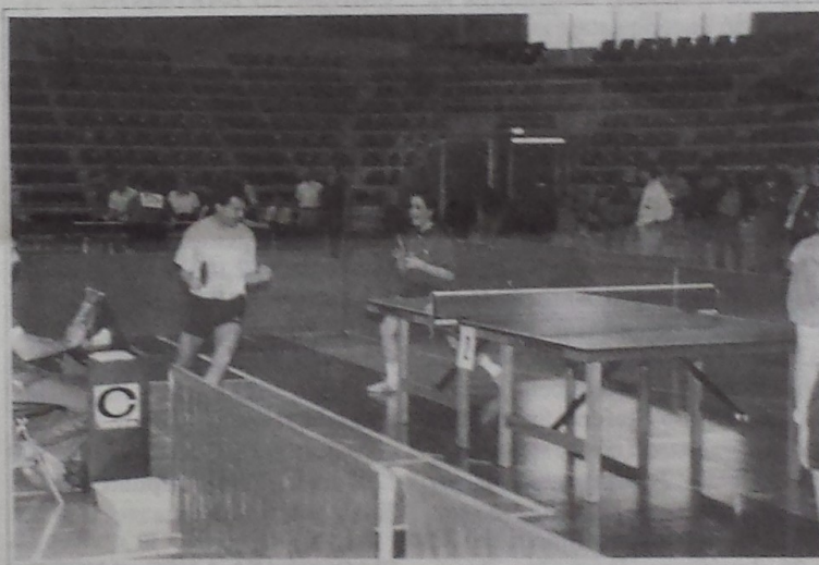
L'urlo di felicità per l'ultimo punto