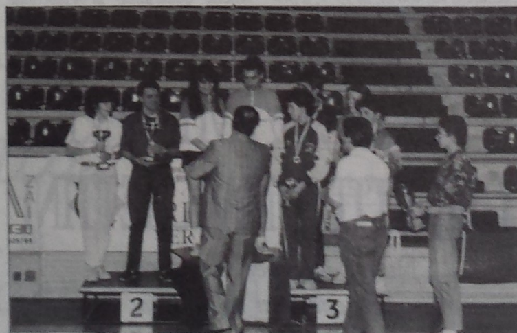
I fratelli Raspi al momento della premiazione